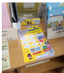
川口市：案内チラシ