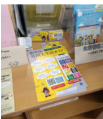
川口市：案内チラシ